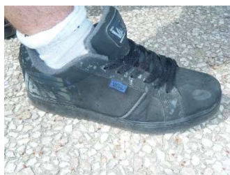
type « VANS »

Les semelles de ces dernières devront être propres pour accéder au gymnase Longo (Directive municipale).