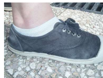
type « CONVERSE »