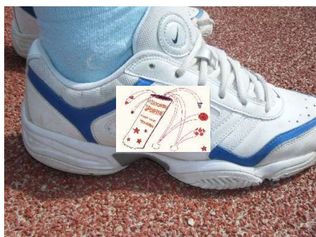
basket, multisport, tennis