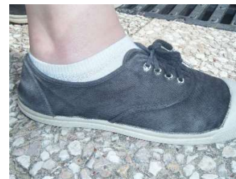
type « CONVERSE »