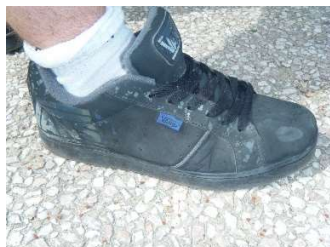
type « VANS »

Les semelles de ces dernières devront être propres pour accéder au gymnase Longo (Directive municipale).